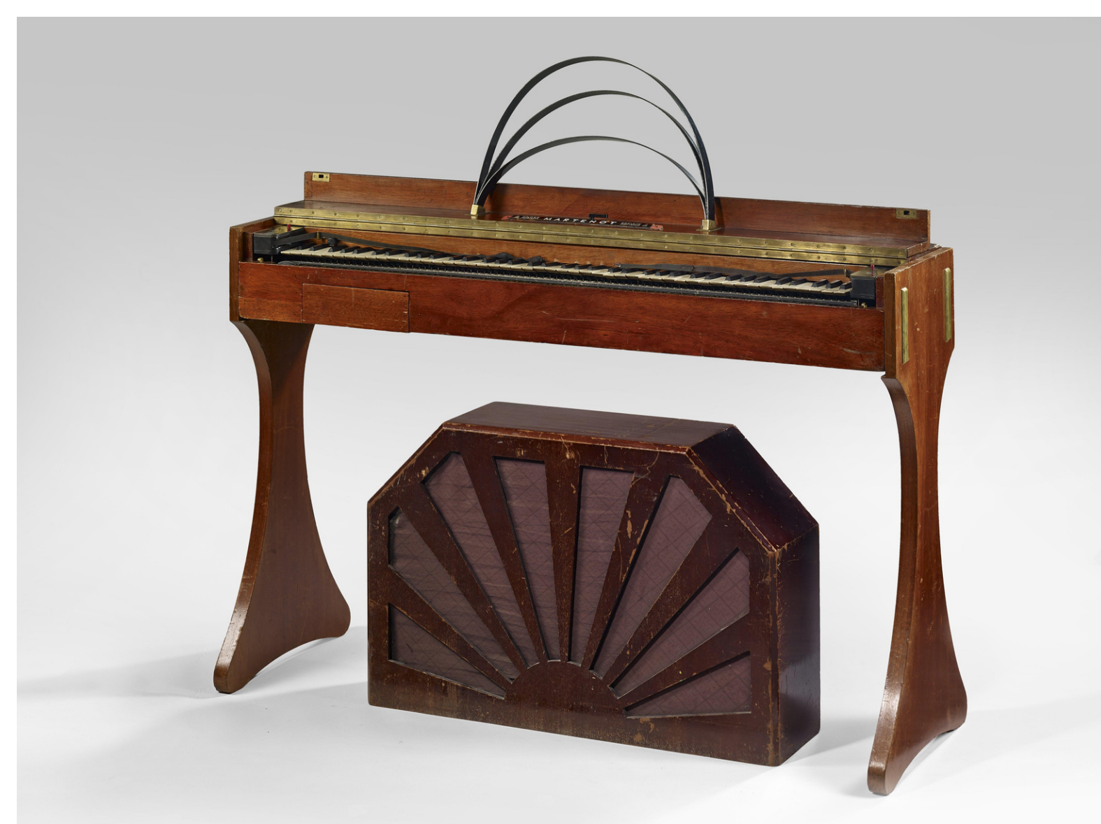
Onde 169 avec diffuseur AB